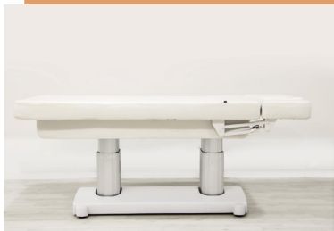
Table de massage électrique Pro

Le large parcours en hauteur (de 68cm à 89cm) facilite l'accès aux patients.